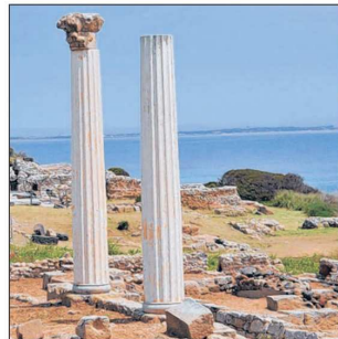
De fotogenieke zuilen bij de ruïnestad Tharros op het schiereiland Sinis.

We sluiten af met een bezoek aan de beschutte baai van Porto Conte, dat tot een beschermd natuurgebied behoort. De weg eindigt bij Capo Caccia. Hier leidt een honderden treden tellende trap uit de ruige kliffen naar de Neptunesgrot, waar rond een ondergronds meer sprookjesachtige druipsteenformaties liggen. Bewonderend kijken we naar deze natuurpracht en begrijpen meteen waarom de rijken van toen er nu op Sardinië zo goed en graag gedijen: het majestueuze eiland is een weelderige voedingsbodem voor betovering door de eeuwen heen.